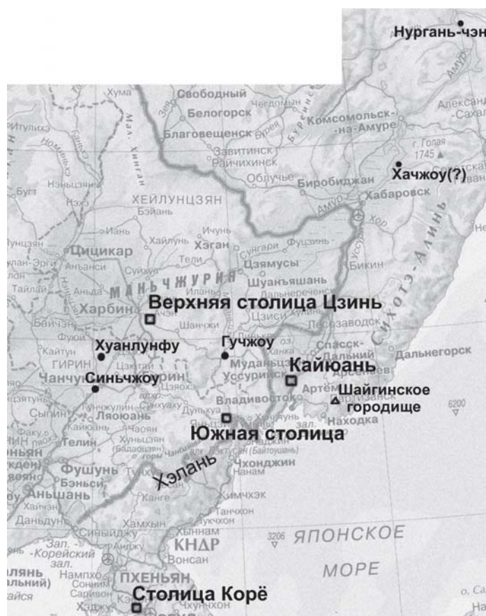
Рис. 2. Шайгинское городище и основные памятники, упоминаемые в «Ляодун чжи»

Центром какой области могло быть Шайгинское городище? Определенным указанием на ее название может послужить запись из «Юань чжи» («Описание империи Юань»), цитируемая в первой главе «Ляодун чжи» («Описание Ляодуна», составленное в 1443–1537 гг.), в разделе «Древние памятники» («Гу цзи»): «... на юго-западе от Кайюаня есть уезд Нинъюань, а далее на юго-запад – Южная столица, от нее еще на юг – область Хэлань, далее на юг – Шуанчэн, который прямо граничит со столицей вана Корё. На запад (от Кайюаня – А.И. ) – округ Гучжоу, на северо-западе – Верхняя столица, т.е. город Хуйнинфу Цзинь. На юге от столицы – Цзяньчжоу, на западе – Биньчжоу. Далее на запад – Хуанлунфу, которую Цзинь переименовала в воеводство (цзюнь – А.И. ) Лишэ. Далее на запад – Синьчжоу, управляет уездом Учан, на севере – Чжаочжоу, управляет уездом Шисин. На востоке – Юнчжоу, Чанчжоу и Яньчжоу. На северо-востоке – Хачжоу, Нурганьчэн – все это города, построенные Бохаем, Ляо и Цзинь, а в Юань упраздненные. Их фундаменты все еще сохраняются» [10, с. 367] (расположение некоторых из упомянутых здесь городов показано на рис. 2). Данная запись является одним из важнейших оснований географической привязки столицы Восточного Ся города Кайюань к Красноярскому городищу [12, с. 561–562]. Согласно этой